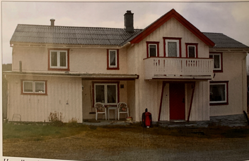
Hovedbygningen på Gammelvollen i Kojan slik den framstår i våre dager.